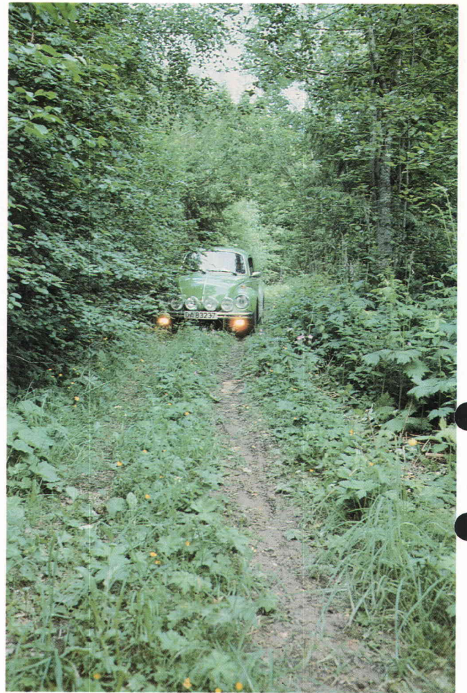
Stifinner'n i god gammel stil.

Start i Stifinner'n i de gode gamle dager.