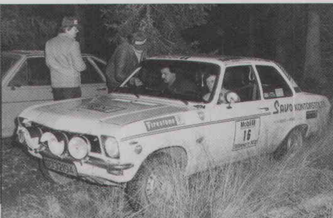
Følkner/Karlan i "Stifinner'n"